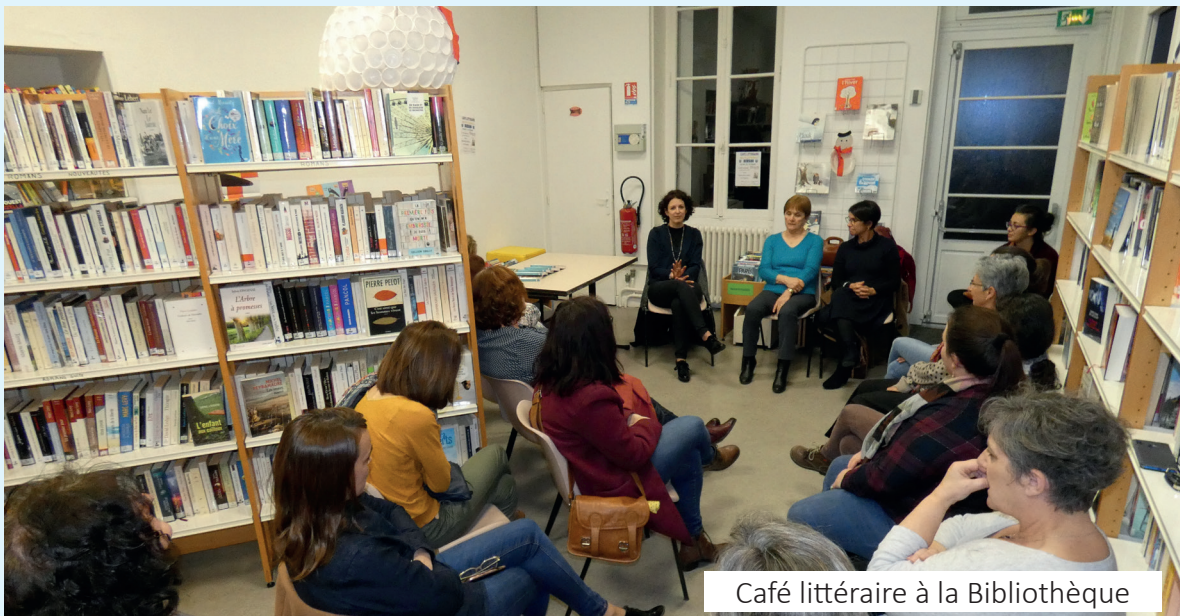
Café littéraire à la Bibliothèque