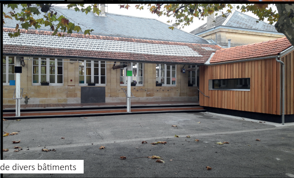
Accessibilité de divers bâtiments

En conclusion, en 20 ans, de nombreuses choses ont été réalisées sur la commune, les dotations plus faibles malheureusement contraignent les projets mais projets il y a, ils mettront plus de temps mais ils se feront.