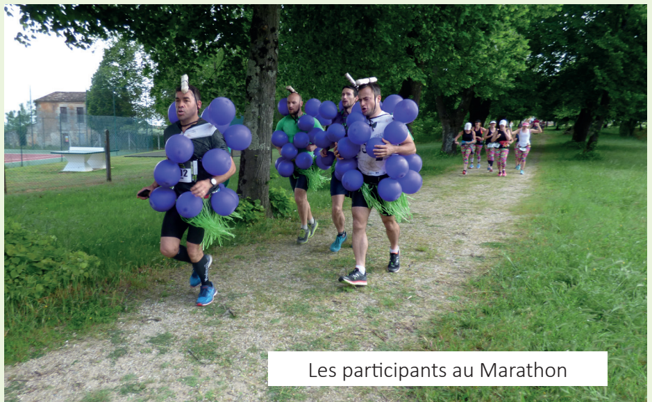
Les participants au Marathon

Après avoir rangé les barrières, tous les bénévoles se sont retrouvés à l'ancienne Mairie pour prolonger, le temps d'un repas, cette journée très particulière. Nous avons beaucoup ri et futurs bénévoles nous vous attendons pour partager ces bons moments en toute simplicité.