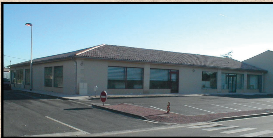
2001 : Inauguration du Pôle Commercial

Année 2000 : Suite au constat de la disparition de nombreux commerces et suite à l'étude effectuée par la chambre de commerce, le conseil municipal a décidé de regrouper les commerces existants en Centre-ville. La superette a vu le jour dès 2001 avec deux autres commerces qui ont été des pièces maitresses de ce projet : la pharmacie et le coiffeur.