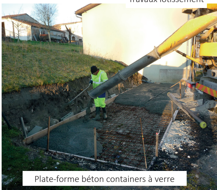
Plate-forme béton containers à verre