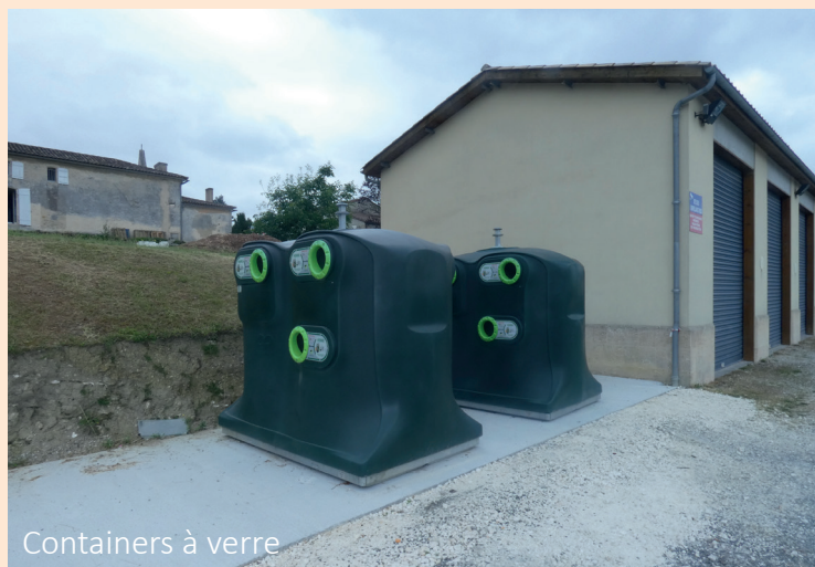
Containers à verre

A ce sujet, nous vous rappelons ces bacs sont uniquement pour le verre, et ne doivent pas être utilisés comme une décharge.