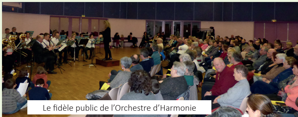
Le fidèle public de l'Orchestre d'Harmonie

Ce fut un grand moment et tout le monde est rentré content de sa soirée. A l'année prochaine.