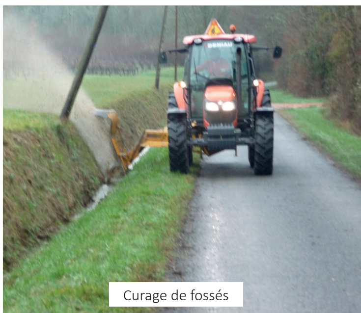
Curage de fossés