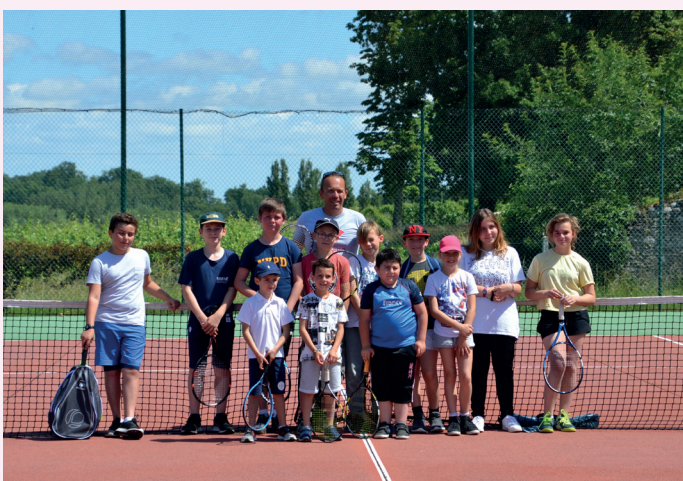
Remise des prix de fin d'année