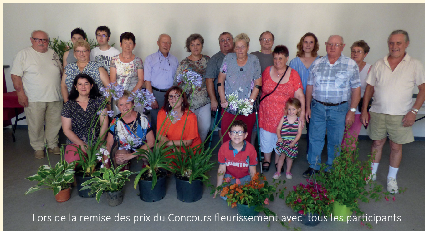
Lors de la remise des prix du Concours fleurissement avec tous les participants