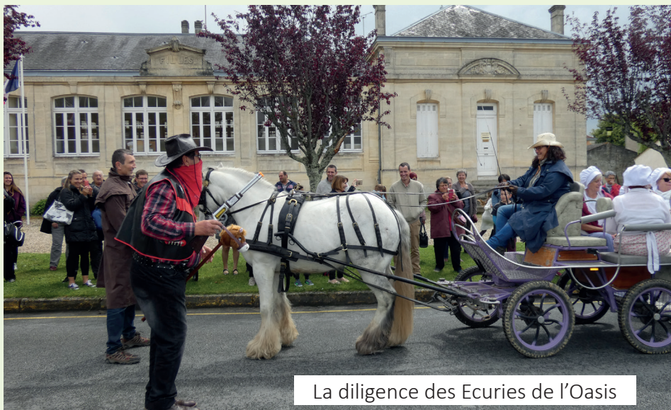
La diligence des Ecuries de l'Oasis

Un grand merci à toutes les personnes qui se sont mobilisées pour que ce moment soit une réussite.