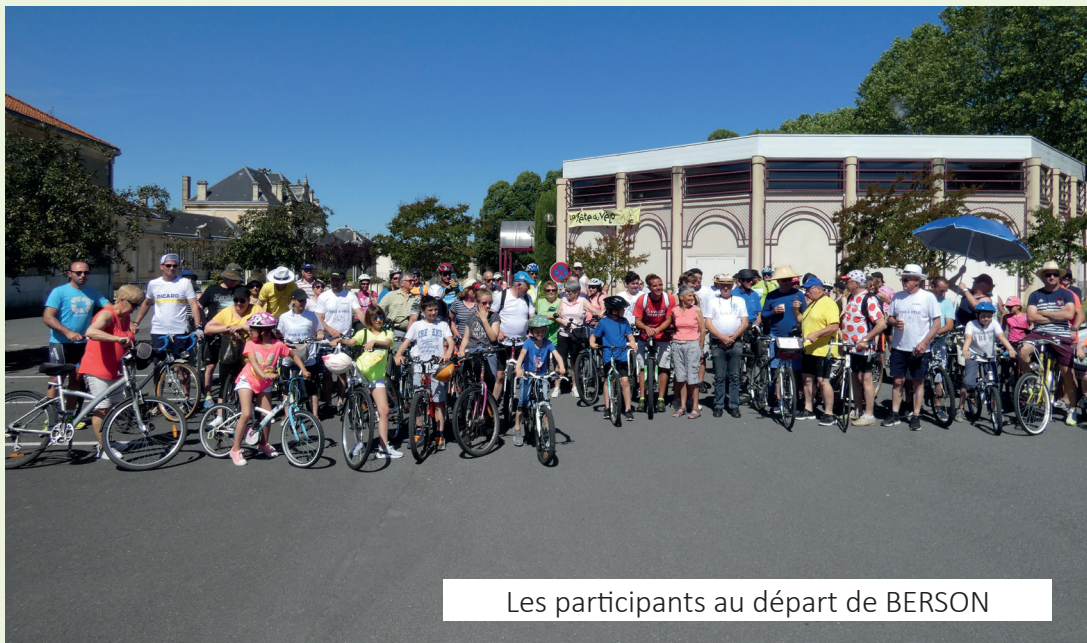
Les participants au départ de BERSON

Certains, nouveaux inscrits, n'ont pas hésité à traverser la Gironde pour partager cette journée bon enfant. Les quatre arrêts traditionnels ont permis de rafraîchir les têtes et les muscles mis à mal par la chaleur. Chaque participant a pu profiter de ces haltes bienvenues pour se nourrir et