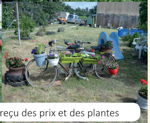
Les jardins qui ont reçu des prix et des plantes