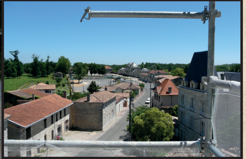
Réfection de l'Eglise