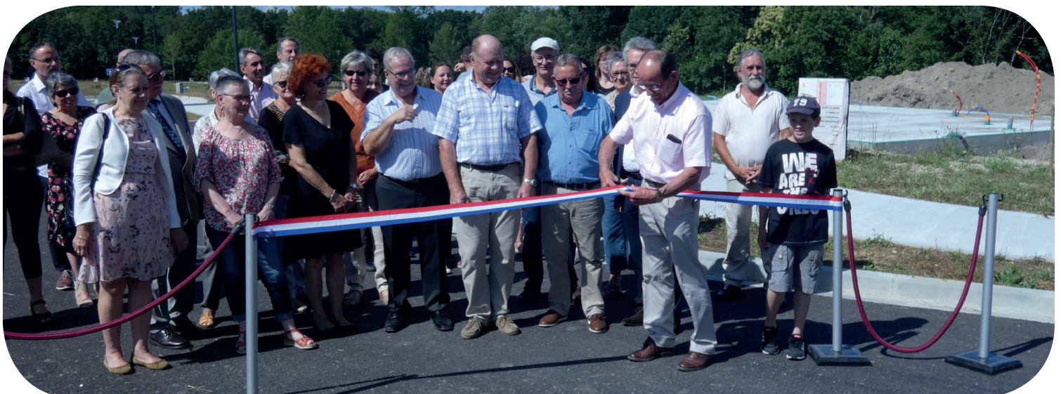
Inauguration du lotissement «Les Lauriers» au Barail