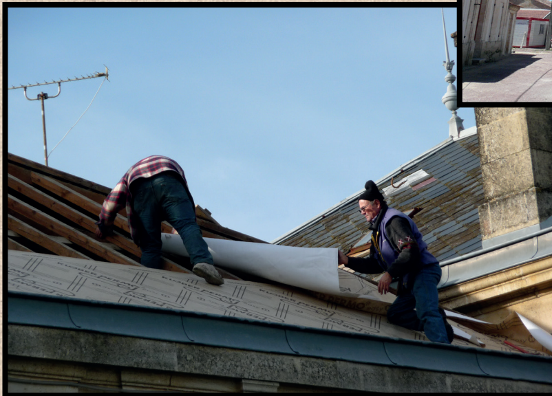
Travaux de toiture de la Mairie, toutes les ardoises ont été récupérées, gravées et remises lors de la fête du Centenaire de l'école.