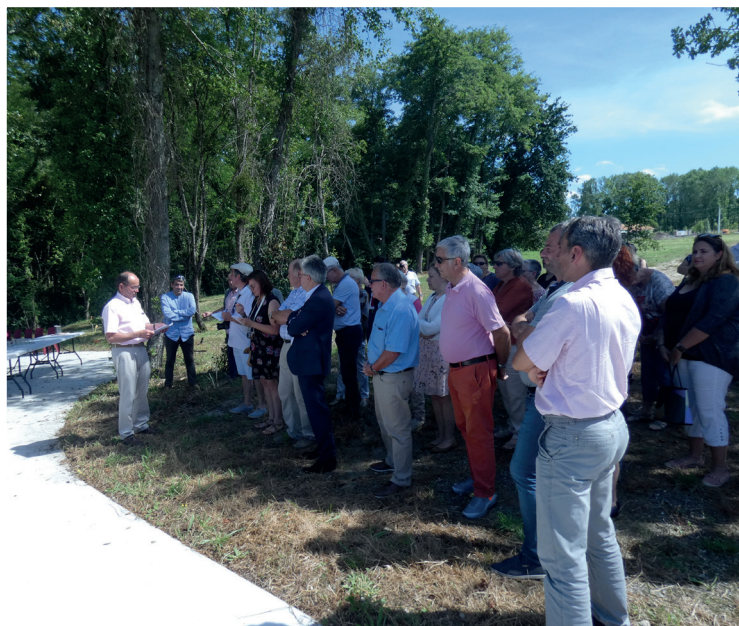
Visite du lotissement et discours du Maire