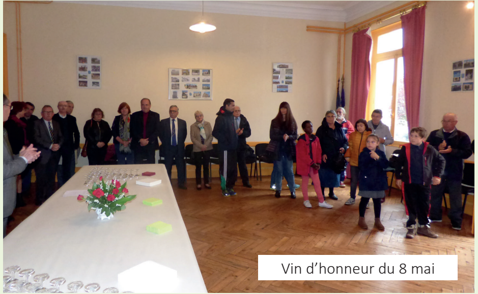
Vin d'honneur du 8 mai

Les accents martiaux de l'harmonie de Berson accompagnèrent cette cérémonie. Un vin d'honneur termina cette commémoration.