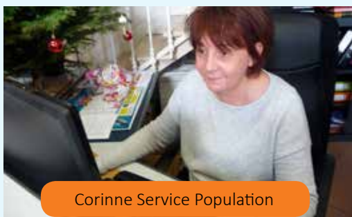
Corinne Service Population