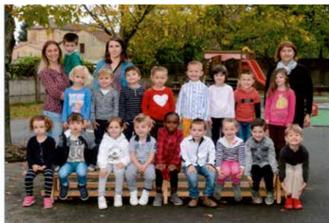
Ecole Berson 2017-2018