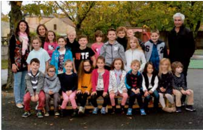
Ecole Berson 2017-2018