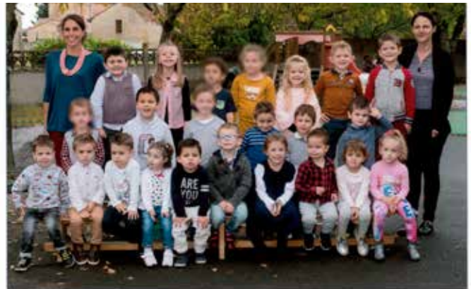
Ecole Berson 2017-2018