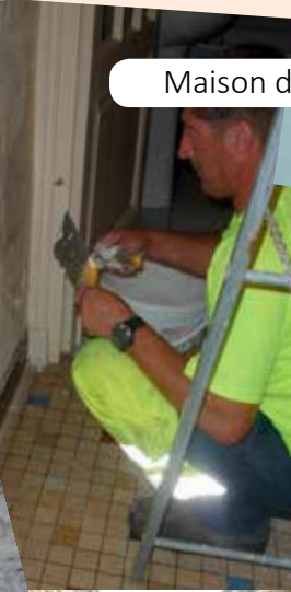
Maison des associations