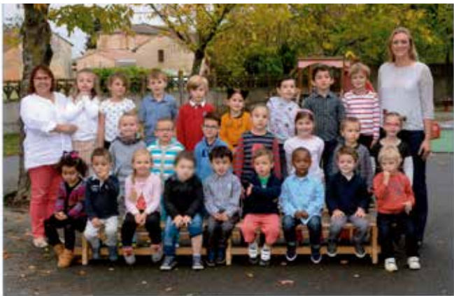
Ecole Berson 2017-2018