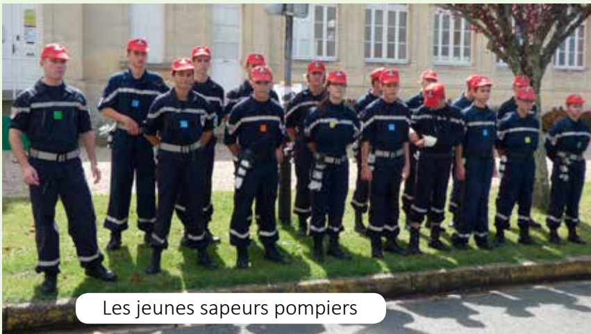
Les jeunes sapeurs pompiers

Pour conclure, cette journée a été un succès malgré la pluie et la participation un peu moins nombreuse. N'oublions pas les scolaires qui dès le vendredi ont participé à des animations sportives sur le stade tout le long de la journée. Il faut rappeler tout de même que l'organisation d'un tel évènement demande en amont beaucoup de réunions de préparation, l'investissement et la volonté tenace de quelques conseillers. Ce rendez-vous annuel auquel nous tenons doit perdurer dans le temps. C'est un moment attendu et même si on a entendu ci et là « que c'était toujours pareil.... », nous finirons par une pointe d'humour : l'an prochain, nous essayerons les sports extrêmes type bobsleigh, ski alpin, patinage, parapente et saut à l'élastique..... du perron de la mairie.