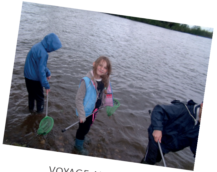
VOYAGE AU TEMPLE SUR LOT