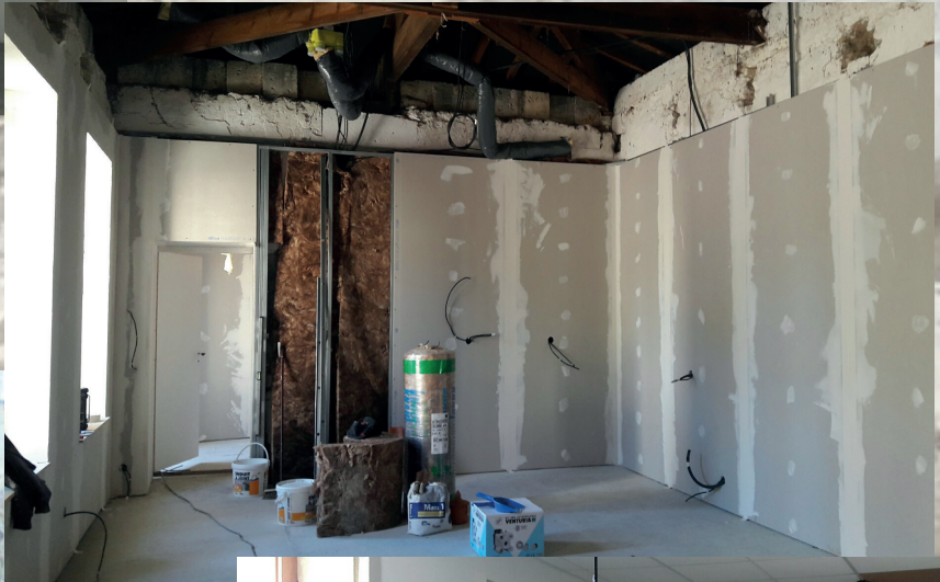
Les travaux actuels à l'ancienne Mairie