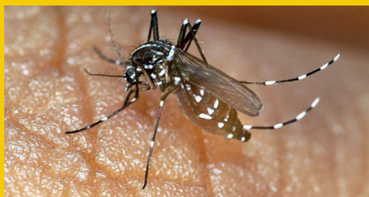
Le moustique tigre

Afin de lutter efficacement contre cette espèce invasive, il est essentiel de supprimer les lieux de reproduction (eaux stagnantes dans les soucoupes, pots de fleurs, réseaux d'eau, fossés...). L'ARS (Agence Régionale de Santé) transmettra très prochainement en Mairie un document d'information relatif à cette problématique afin de sensibiliser les habitants pour que chacun soit acteur de la lutte contre les moustiques.