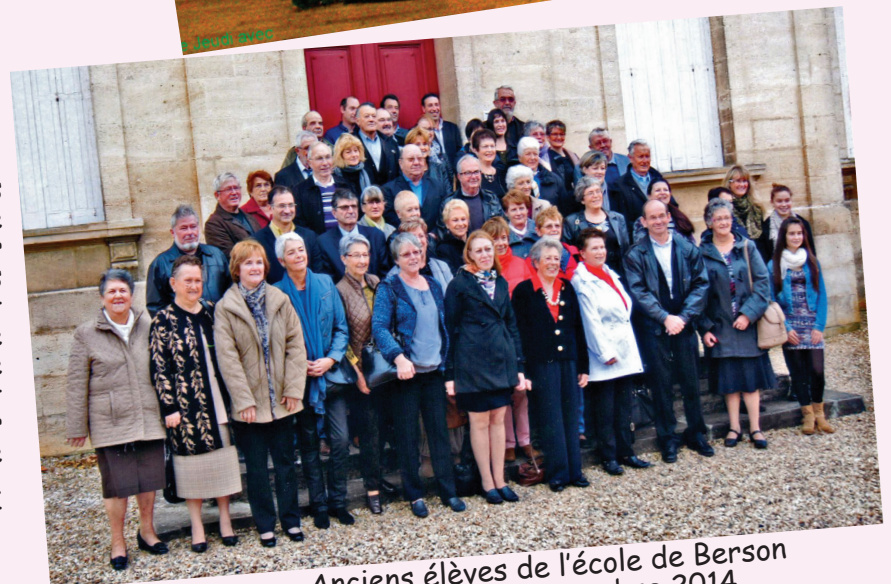
Anciens élèves de l'école de Berson repas du 25 novembre 2014

En présence de M. le Maire et de mesdames les enseignantes, les anciens de la récréée se sont retrouvés au Foyer Rural, pour partager un copieux et délicieux repas. Tous n'ont pas répondu présent à l'appel, mais malgré tout nous étions soixante-dix à nous remémorer de bons souvenirs. Autour des photos exposées de ce temps-là, chacun a essayé de reconnaître et de mettre un nom sur chaque élève. Enfin pour fixer ce moment présent une photo de groupe a été prise sur les marches du groupe scolaire. Une super journée de retrouvailles, de joie et de convivialité.